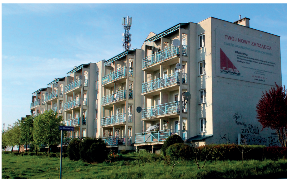
Budynek przed remontem