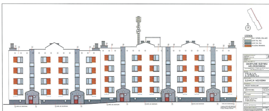
Projekt docieplenia budynku wraz z kolorystyką

mieszkańczych Zarząd Spółki podjął decyzję o zakupie traktorka do koszenia trawy. Koszenie tak rozległych trawników na osiedlu o powierzchni ok. 1,5 ha pochłaniało naszym konserwatorom sporo czasu i sił. Mamy nadzieję, że traktorek zdecydowanie ułatwi i usprawni pielęgnację trawników i sprawi, że czynność, która do tej pory wymagała dużego nakładu sił, stanie się znacznie przyjemniejsza. Traktorek ten może się przydać również zimą do odśnieżania chodników po zakupie do niego odpowiedniego pługu do śniegu. Na przełomie maja i czerwca br. Spółka ogłosiła dwa przetargi: na wymianę i konserwację stolarki okiennej w zasobach mieszkaniowych GTBS oraz na docieplenie wraz z kolorystyką budynku mieszkalnego przy ul. Dekerta 75-77 w Gorzowie Wlkp. Zakres prac związanych z termomodernizacją ww. budynku obejmować będzie: wykonanie docieplenia wszystkich elewacji budynku, remont balustrad balkonów (malowanie), wymiana pokryć dachowych i daszków, wymiana elewacyjnych kratki wentylacyjnych, wymiana wszystkich okien drewnianych, wymiana rur spustowych i rynien, wykonanie opaski, malowanie elewacji. Liczymy, że uda nam się wyłonić wykonawców, którzy zrealizują nasze plany i zamierzenia, które nie doszły do skutku w ubiegłym roku ze względu na trudny czas związany z wybuchem pandemii.