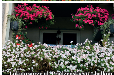
Lokator przy ul. Prądzińskiego – balkon