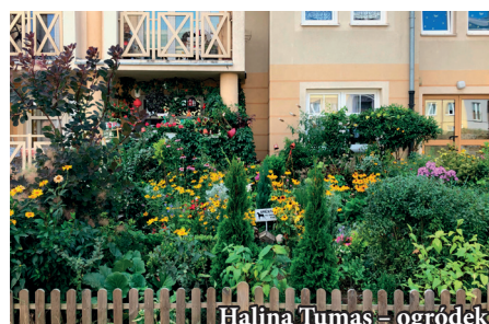
Halina Tumas – ogródek