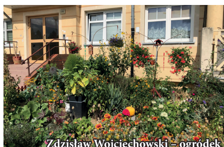
Zdzisław Wojciechowski – ogródek