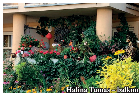
Halina Tumas – balkon